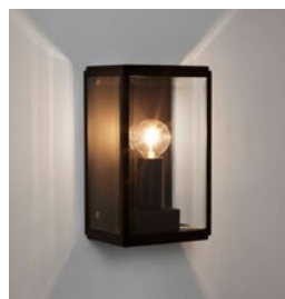
CODE: 1095013 FINISH: TEXTURED BLACK