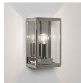
CODE: 1095014 FINISH: POLISHED NICKEL

THIS PRODUCT IS NOT SUITABLE FOR INSTALLATION WITHIN FIVE MILES OF THE COAST. FOR THESE ENVIRONMENTS, PLEASE FILTER PRODUCTS ON THE ASTRO WEBSITE BY 'COASTAL'.