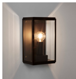
CODE: 1095013 FINISH: MATT BLACK