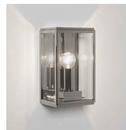
CODE: 1095014 FINISH: POLISHED NICKEL

THIS PRODUCT IS NOT SUITABLE FOR INSTALLATION WITHIN FIVE MILES OF THE COAST. FOR THESE ENVIRONMENTS, PLEASE FILTER PRODUCTS ON THE ASTRO WEBSITE BY 'COASTAL'.