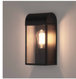
CODE: 1339001 FINISH: TEXTURED BLACK