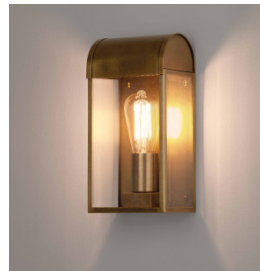
CODE: 1339003 FINISH: ANTIQUE BRASS

THIS PRODUCT IS NOT SUITABLE FOR INSTALLATION WITHIN FIVE MILES OF THE COAST. FOR THESE ENVIRONMENTS, PLEASE FILTER PRODUCTS ON THE ASTRO WEBSITE BY 'COASTAL'.