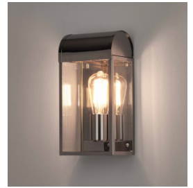
CODE: 1339002 FINISH: POLISHED NICKEL