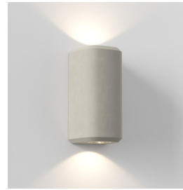
Code: 1513004 Finish: Grey Concrete