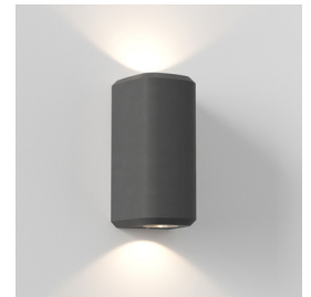
Code: 1513016 Finish: Charcoal Concrete

This product is suitable for use by the coast and other onerous environments – ten year warranty applies, except when the product has an integral led and/or driver in which case, a three year warranty applies. For further warranty information please refer back to the original point of purchase.