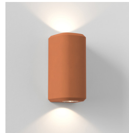
Code: 1513014 Finish: Terracotta Concrete