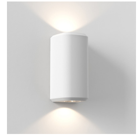
Code: 1513011 Finish: White Concrete